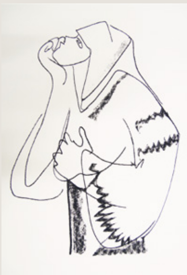
links oben: Jaroslav Šváb Komposition , 1974 Linolschnitt