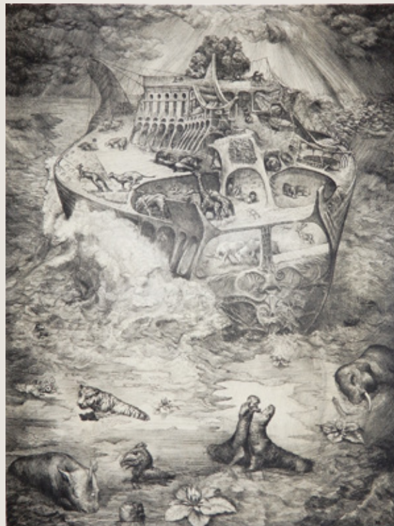
rechts: Robert Baramov Die Flut (Arche Noah) , 1993 Lithografie